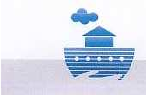
Associazione Orizzonti dell'Arca