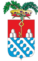
PROVINCIA DEL VERBANO CUSIO OSSOLA